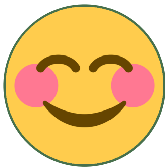
Tabla para hablar de emociones